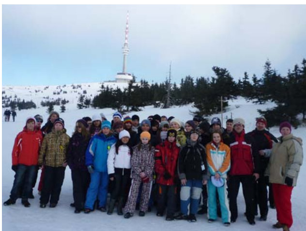
Českopolský lyžařský týden

7. Exkurze do Osvětimi. Školní projekt pro žáky vyšších ročníků v rámci prevence sociálně patologických jevů.