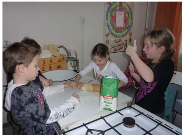
Z činnosti školní družiny