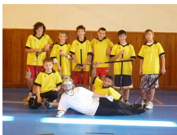
Naše účast na sportovních soutěžích