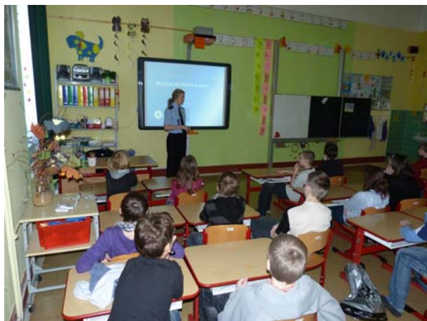
Spolupráce s Městskou policií v Krnově a s Policií ČR