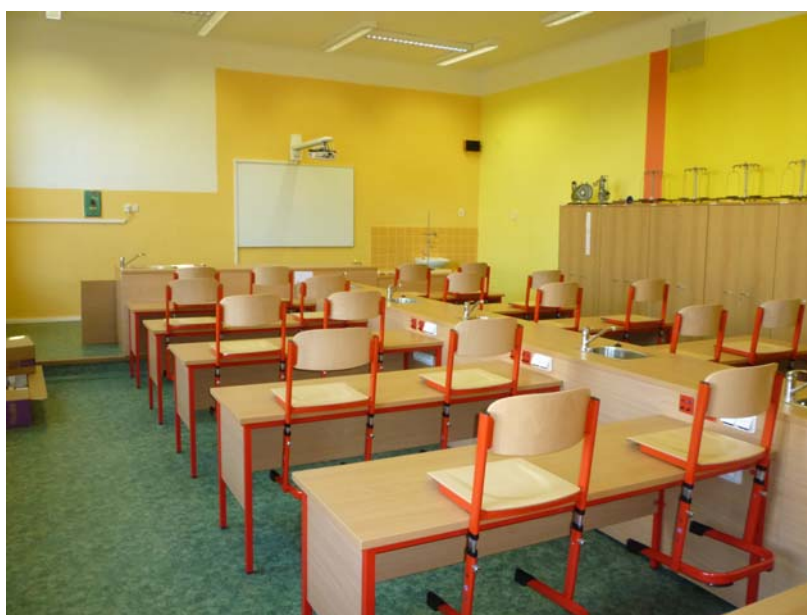
Rekonstruovaná učebna CH, F, Př