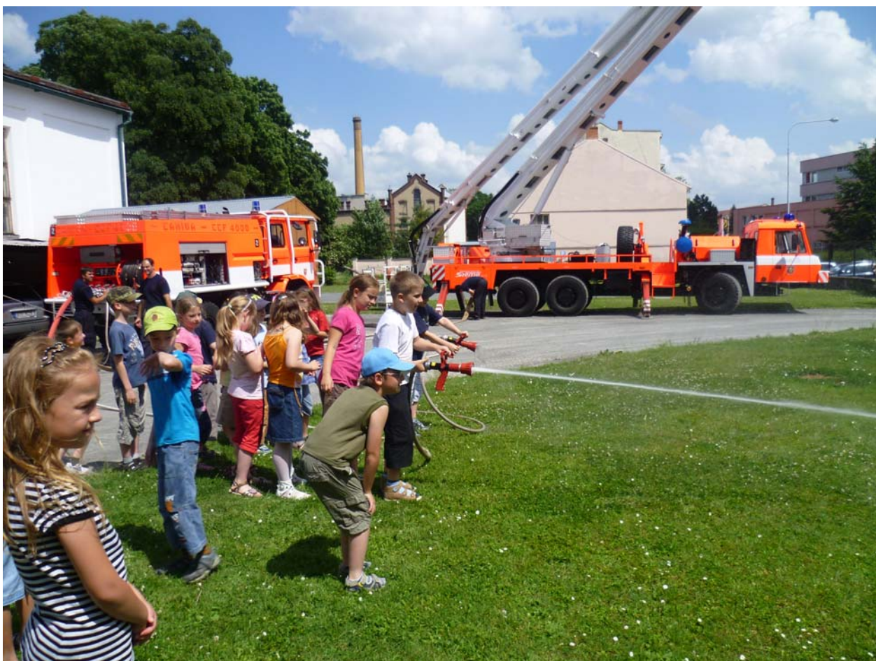
Z akcí školní družiny